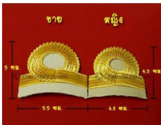
ระดับซี ๒

- เครื่องแบบปฏิบัติราชการ (ชุดก่ากี) ๑ แถบเล็ก แถบบนขมวด