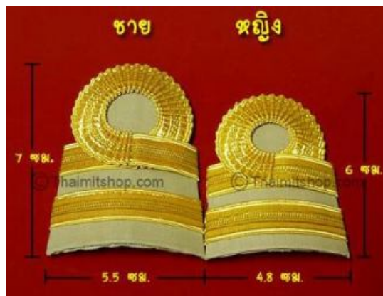
ระดับซี 3 – 4

- เครื่องแบบปฏิบัติราชการ (ชุดก่ากี) ๑ แถบเล็ก แถบบนขมวด