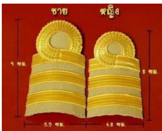
ระดับซี 5 – 6

- เครื่องแบบปฏิบัติราชการ (ชุดก่ากี) 2 แถบเล็ก แถบบนขมวด