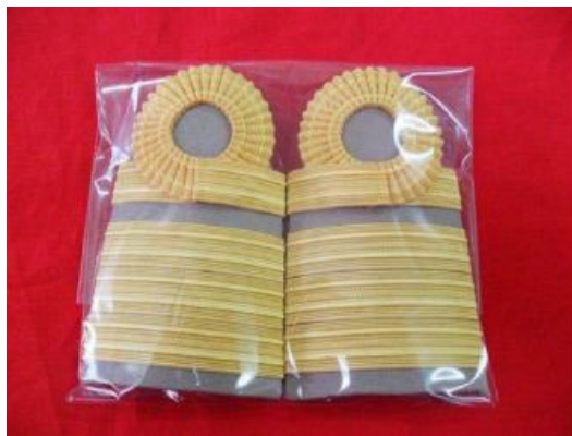
ระดับซี 7 – 8

- เครื่องแบบปฏิบัติราชการ (ชุด kaki) 1 แถบใหญ่ แถบบนขมวด