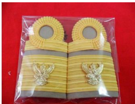
ระดับซี 9 ขึ้นไป

- เครื่องแบบปฏิบัติราชการ (ชุด kaki) 1 แถบใหญ่ แถบบนขมวด